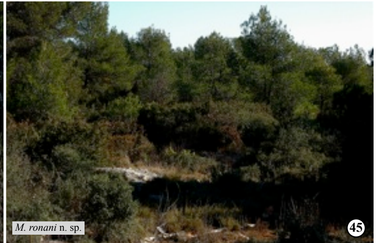
M. ronani n. sp.